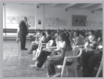
Dia do Coroinha (DDC)