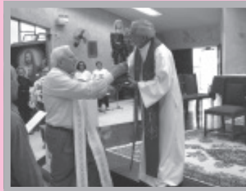
Chegada da Imagem de Nossa Senhora do Rosário em nossa comunidade, catequizandos oferecem flores à padroeira da Diocese