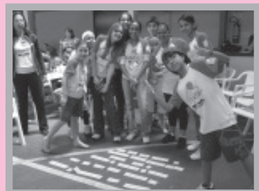
Gincana Bíblica agitou nossa comunidade na último domingo do mês de setembro