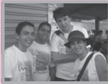
Jovens da nossa comunidade no Gritos dos Excluídos