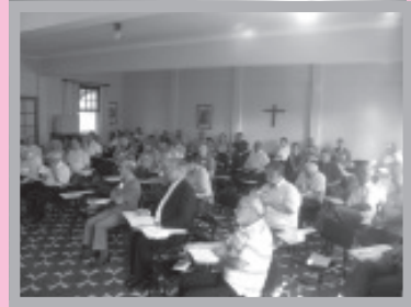
Retiro do Clero em Itaiaci