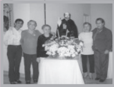
Comunidade CEB'S - Santo Inácio de Loyola que completou 20 anos